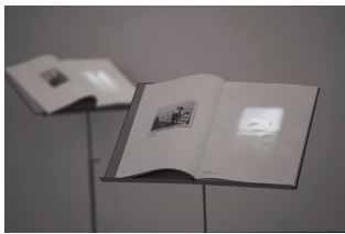
Photo.SaintGermain 6-21 novembre 2020 Vernissage jeudi 5 novembre de 16h à 21H

A PPR OC HE Salon dédié à l'expérimentation du médium photographique http://approche.paris/fr