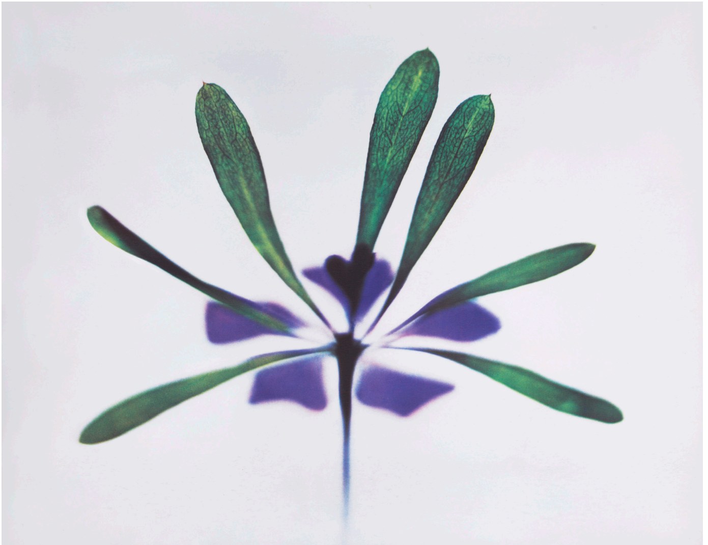
Bertrand Hugues, 2020JBBH10, 2020, tirage Fresson au charbon direct, 75,5 x 59,5 cm 5 ex + 2 E.A.