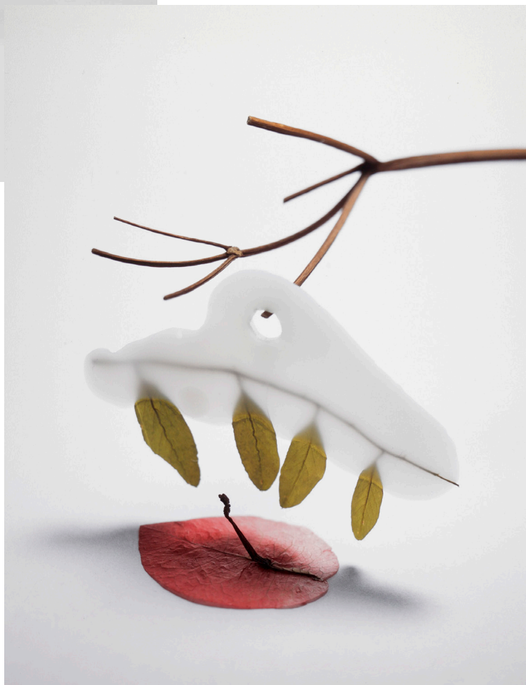
Bertrand Hugues, 2020JBBH02, 2020, tirage Fresson au charbon direct, 75,5 x 59,5 cm, 5 ex + 2 E.A.