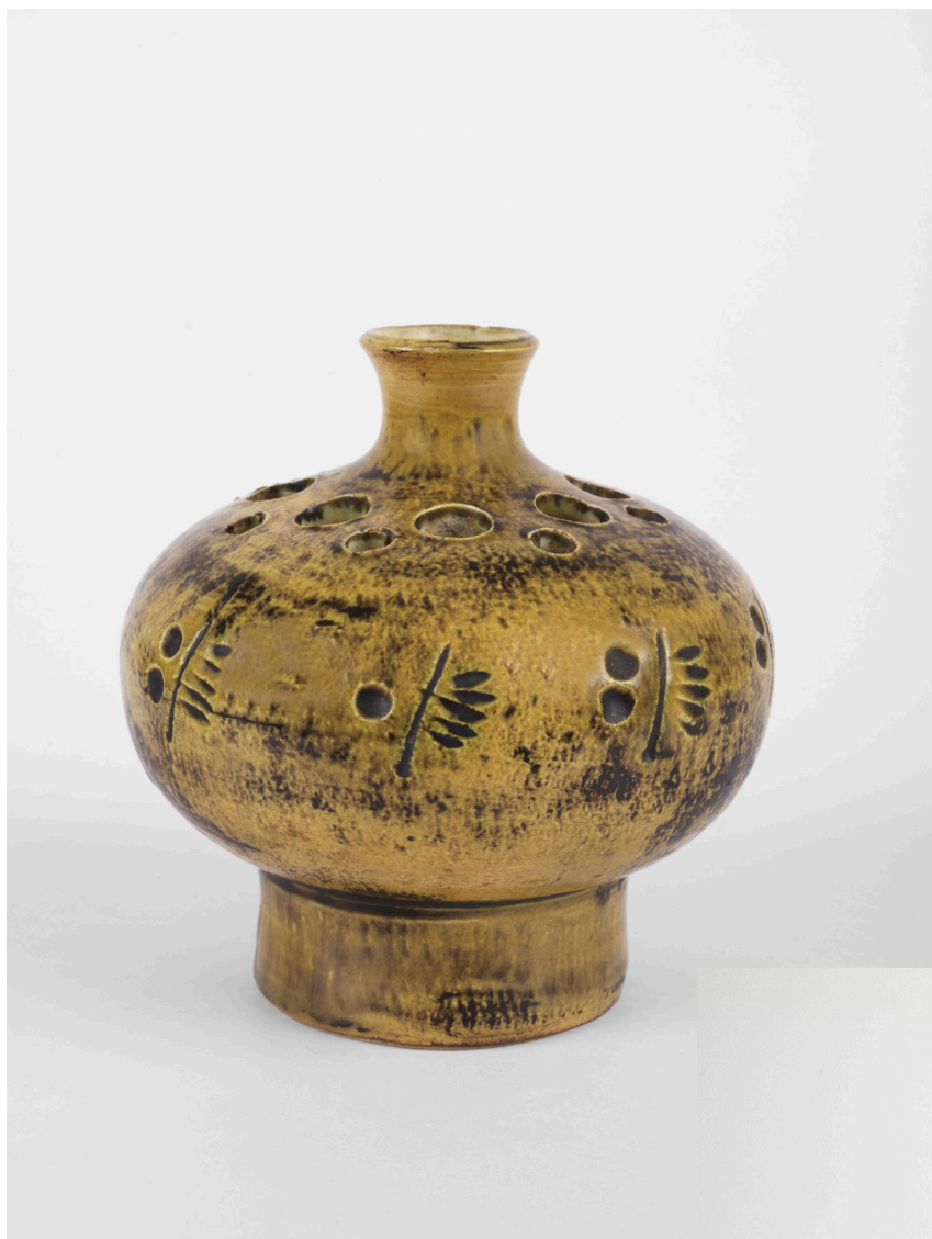
Jacques Blin, petit vase en faïence gravé de végétaux, faïence scarifiée et vernissée, vers 1970